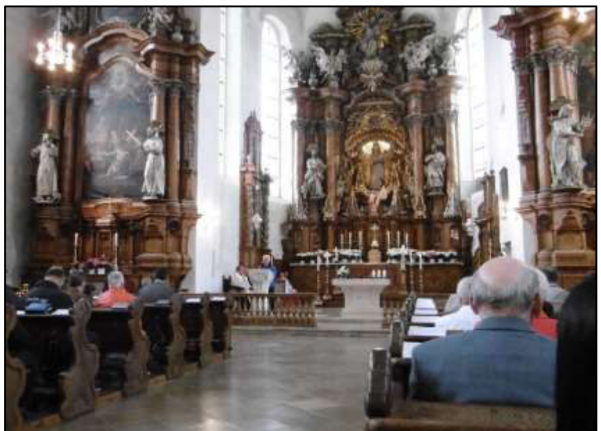
Gut besuchte Bezirks-Maiandacht in der Ehinger Liebfrauenkirche.

Beim nächsten Punkt befasste man sich mit der Vermietung der unteren Räume (Junge-Erwachsenen-Raum) im Kolpinghaus. Sie sollen nur noch an Mitglieder vermietet werden. Gewerbliche Veranstaltungen können nur noch im Obergeschoss stattfinden. Ausnahmen gibt es nur in Absprache mit dem Vorstand. Berechnet werden 50,- € für Junge-Erwachsenen-Raum und 35,- € für den „Blauen Raum“ und beide zusammen 70,- €. Max Maier