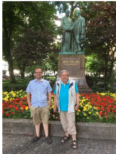
Kolpingdenkmal 1912 und 2023